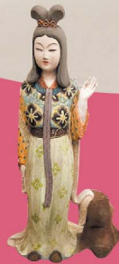
「天童美人像」 中尾琢子

今回は、水彩色鉛筆画とペン画に加え、石に絵を描いた作品や、私の絵をウッドパーニングで制作してくださった作品も展示いたします。いろいろと見て楽しんでいただくと嬉しく思います。